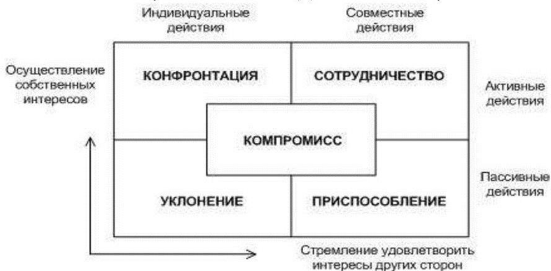
Схема стратегий поведения в конфликте

4. Расставьте в правильном порядке этапы преодоления конфликта